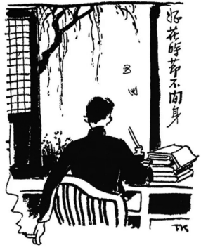
· 枯斋漫读 ·

欧阳修,字永叔,祖籍庐陵(今江西吉安),宋真宗景德四年(1007年)六月二十一日生于四川绵阳。宋神宗熙宁四年(1071年)六月,以观文殿学士、太子少师致仕于颍州(今安徽阜阳),明年闰七月病卒,年六十六,赠太子太师,谥“文忠”。 欧阳文忠公,一生著文作诗一千三百余篇,皆天才自然,丰约中度,亲撰《新五代史》,望晋《史记》,更兼为官一方皆能与民同乐,正所谓丰碑巍峨。但其某为,欧阳公一生光彩与出处大节尽见于《与高司谏书》《朋党论》《上范司谏书》数篇。