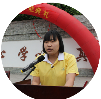
敬爱的老师、家长、亲爱的同学们: