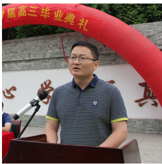
尊敬的各位领导、家长、老师、亲爱的同学们:

大家早上好! 当钟秀教学楼前, 玉兰花开的时候, 2017 年的毕业季已经悄然来临。今天, 怀着喜悦、激动和不舍的心情, 我们迎来了宿州二中 2017 届高三毕业典礼。在此, 我谨代表高三全体教师, 向在座的志存高远的青年学子们, 献上最诚挚的祝福。