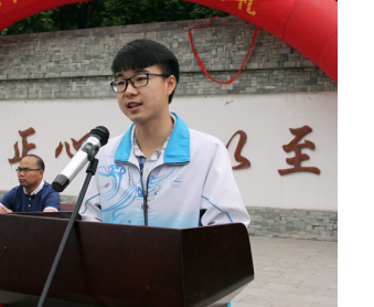
此刻, 站在 6 月的门口, 你们比以往任何时候都更接近真正的自己, 比以往任何时候都更接近自己的梦想! 出发的号角就要吹响, 请把母校师友的祝福装进行囊。

在这一刻, 我想起了当年拿破仑率领大军翻越阿尔卑斯山的豪言壮语: “在山的这边, 是枪炮和泥泞; 在山的另一边, 有鲜花和美酒!” 那么, 我们还等待什么呢? 行动起来! 为了明年六月的鲜花, 为了醉人的美酒, 为了破茧成蝶的美丽, 为了凤凰涅槃的新生, 请全体同学立起和我一起举起右手自信地高喊: 学业水平测试, 我来啦! 高三, 我来啦!